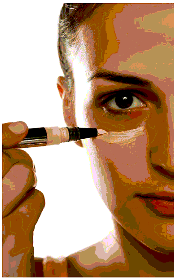
Oltre ad applicare gel ed emulsioni, anche il giusto make-up può aiutare per camuffare le occhiaie

CONTROMISURE. Sul fronte delle contromisure, la soluzione è soprattutto «locale», fatta salva l'importanza di un'alimentazione sana e di una corretta e regolare attività fisica. «L'approccio a questo inestetismo è tendenzialmente topico», sottolinea Andrea Fratter, ricercatore in Cosmologia e Nutraceutica, presidente della Società Italiana Formulatori Nutraceutici e docente della Scuola di medicina estetica Sime, «con prodotti da applicare localmente, sotto forma di sieri, gel ed emulsioni che contengono principi attivi in grado di normalizzare la circolazione venosa e linfatica. Sostanze come la caffeina ad esempio, che concorre a normalizzare il microcircolo, oppure alcuni flavonoidi come rutina e quercetina, molto importanti perché oltretutto ripristinano la normalità del tessuto dermo-epidermico se in corso ci sono infiammazioni. Per combattere la pigmentazione importanti sono le sostanze ad azione schiarente, anche queste da applicare topicamente in sieri, gel ed emulsioni. Quelle meglio conosciute e la cui efficacia è stata più largamente provata sono N-acetilglucosamina (sostanza precursore dell'acido ialuronico e che svolge un ruolo fondamentale nella normalizzazione della sintesi di melanine) e l'acido ascorbico, ovvero la ben nota vitamina C, veicolata però in forma stabile altrimenti si ossiderebbe. Molto utile è infine la